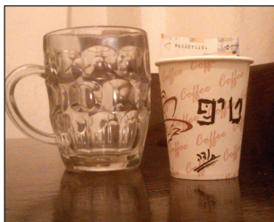
המשך בעמוד 7

בדברים אלו נאמן בעל ספר החינוך לדרכו, לדלות מתוך מצוות התורה גם הנהגות מוסר ואורחות יושר, החורגים מן ההלכה המחייבת והם בבחינת 'מידת חסידות'. אלא שכאן, כבר תמהו האחרונים (ראה "מנחת חינוך" על אטר), שלכאורה הנהגה זו אינה משתמעת מתוך המצוה עצמה. זאת משום שלהלכה (רמב"ם, הל' עבדים ג, יב) אין מצות הענקה נוהגת אלא במי שמכרוהו בית-דין ולא בעבד שמכר עצמו. ממילא, אם מצות הענקה עצמה אינה נוהגת אלא